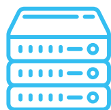
Serveurs & VM dédiés