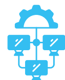
Infrastructure Client existante