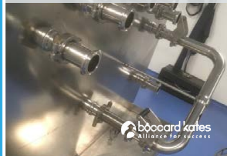
Modyfikacja panela transferowego na wersję z BocLock (użycie adapterów zaciskowych / BocLock), aby zachować oryginalny TP