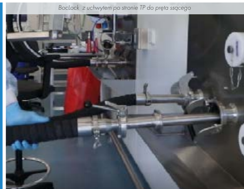
BocLock z uchwytem po stronie TP do pręta ssącego