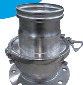
En cours de brevetage